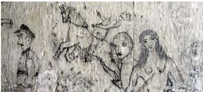
Teilansicht der Bleistiftzeichnungen im ehem. „Kleinen Krankensaal“

Von Häftlingen angefertigte Bleistiftzeichnungen machen dies auf eine besondere Weise möglich. Sie dokumentieren die Erfahrungen und Sehnsüchte der Männer im KZ Drütte. Zukünftig werden sie im Rahmen einer Gedenkstättenführung zugänglich sein.